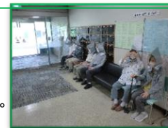
真夏のためロビーに避難

8月に地震を想定した避難訓練を実施しました。南海トラフ地震を想定して、緊急地震速報を放送し、防災頭巾を特養・養護入所者をはじめ、短期・デイサービス利用者にも装着していただき、職員の誘導により避難しました。今後も継続させていただき予定。災害対策をより一層深めていきたいと考えております。